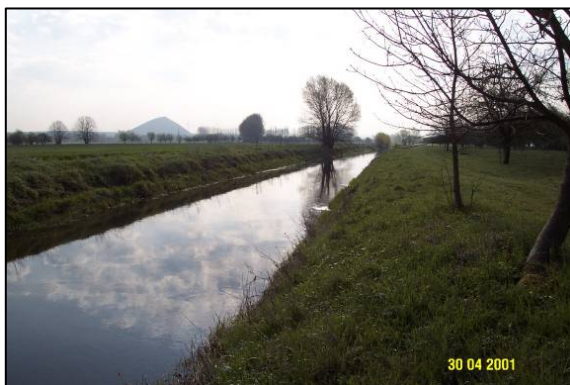
Helme im Kreuzungsbereich (FFH-Gewässer)