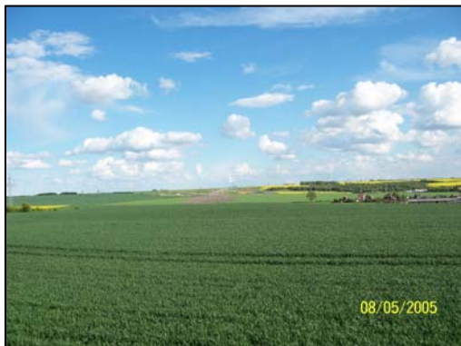
Beginn der Baustrecke