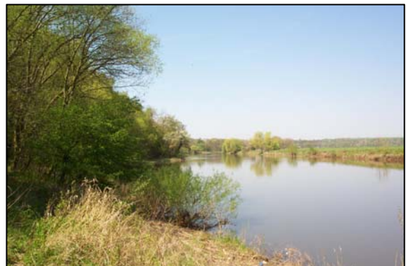
Saale im Querungsbereich