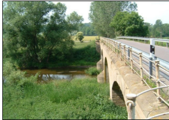
Abbildung: K 2223alt, Blickrichtung von Ost nach West (Richtung Koßweda)