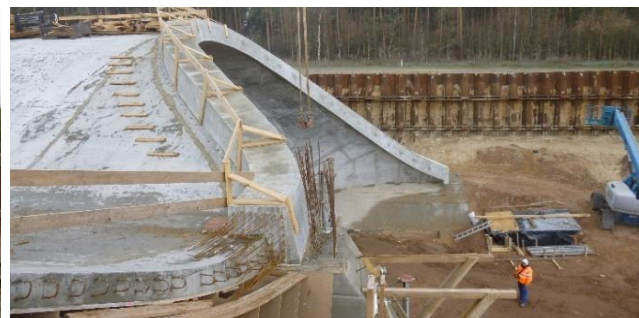
Abgeschalter Bogen mit Anschlussbewehrung