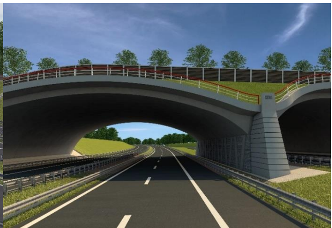
Nordansicht Bogen über BAB 14 (Visualisierung)