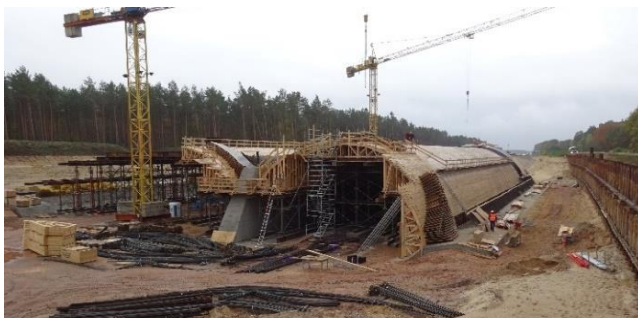
Herstellung Traggerüst inkl. Schalung Überbau