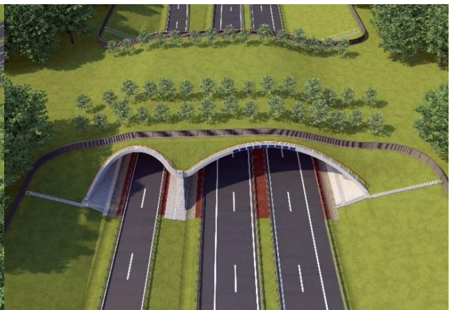
Ansicht von oben (Visualisierung)